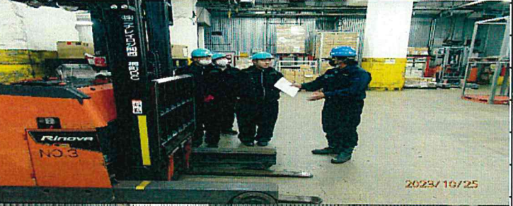
図3 リフトに乗車してもらいリフトの死角について体験して頂きました。